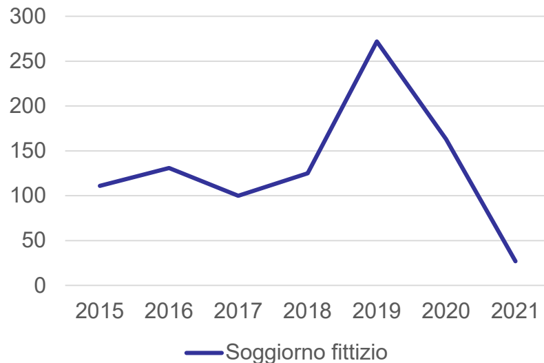
Evoluzione decisioni soggiorno fittizio 2015/2020