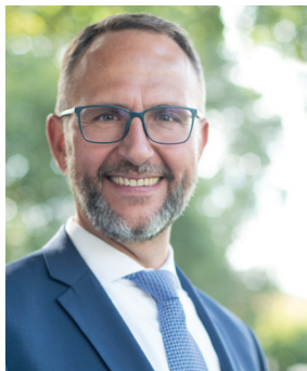
Norman Gobbi, Consigliere di Stato e Direttore del Dipartimento delle istituzioni

In questo periodo storico il concetto di mobilità assume sempre nuovi significati e la percezione verso il traffico veicolare è sempre più polarizzata. Per molte persone potersi spostare utilizzando la propria vettura è l'unica soluzione possibile, anche se spesso risulta difficoltoso e impegnativo muoversi nel traffico. Per taluni, in tante circostanze, è una cattiva abitudine che potrebbe essere cambiata.