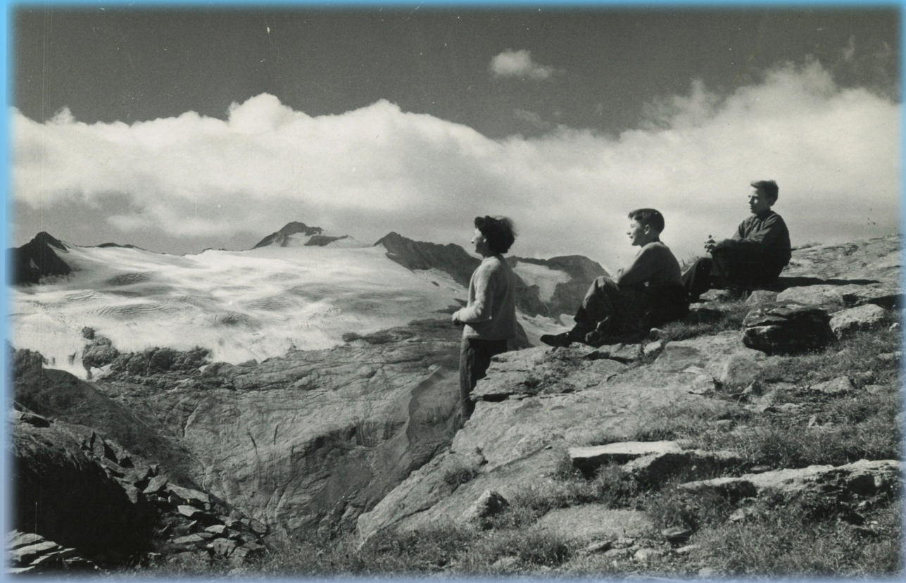
Basodino, 1953.

Incontro Vernice mostra e Conferenza Presentazione Spettacolo Concerto Premiazione Giornata cantonale