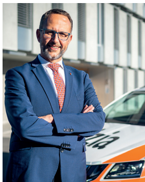
Norman Gobbi, Consigliere di Stato e Direttore del Dipartimento delle istituzioni

Nel nostro Cantone il discorso sulla sicurezza stradale spesso si concentra su multe e radar. Tuttavia, questi ultimi sono solo due aspetti di una strategia più ampia e strutturata del Dipartimento delle istituzioni, il quale promuove la sicurezza sulle strade attraverso diverse iniziative, come ad esempio il progetto “Strade sicure”, ma anche con eventi puntuali. Tra questi, la giornata di porte aperte della Sezione della circolazione, prevista il 4 maggio 2024 a Camorino, rappresenta un'opportunità privilegiata per dibattere sulla sicurezza stradale, condividere opinioni ed esprimere eventuali preoccupazioni.