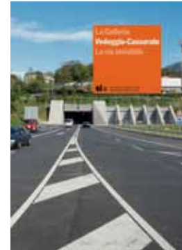
La Galleria Vedeggio-Cassarate. La via invisibile Repubblica e Cantone Ticino

Neuchâtel, UST, 2012 100 pagine Prezzo fr. 23.- N. di ordinazione 1291-1200