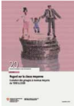
Regard sur la classe moyenne. Évolution des groupes à revenus moyens de 1998 à 2009 Stephan Häni et al., Office fédéral de la statistique

I timori concernenti la progressiva erosione dei gruppi di reddito medio e le teorie sulla continua crescita, per gli stessi gruppi, degli oneri determinati dalle spese obbligatorie sono sempre più spesso oggetto di discussione. Secondo lo studio dell'Ufficio federale di statistica, che descrive l'evoluzione e la composizione proporzionale dei gruppi di reddito medio dal 1998 al 2009 nonché gli oneri determinati dalle spese obbligatorie a cui questi gruppi hanno dovuto far fronte, queste tesi non trovano chiare conferme.