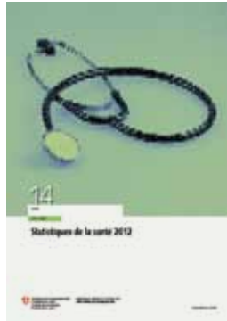
Statistiques de la santé 2012 Section Santé, Office fédéral de la statistique

Neuchâtel, UST, 2013 31 pagine Prezzo fr. 8.- ISBN 978-3-303-20031-5 N. di ordinazione 1271-1201