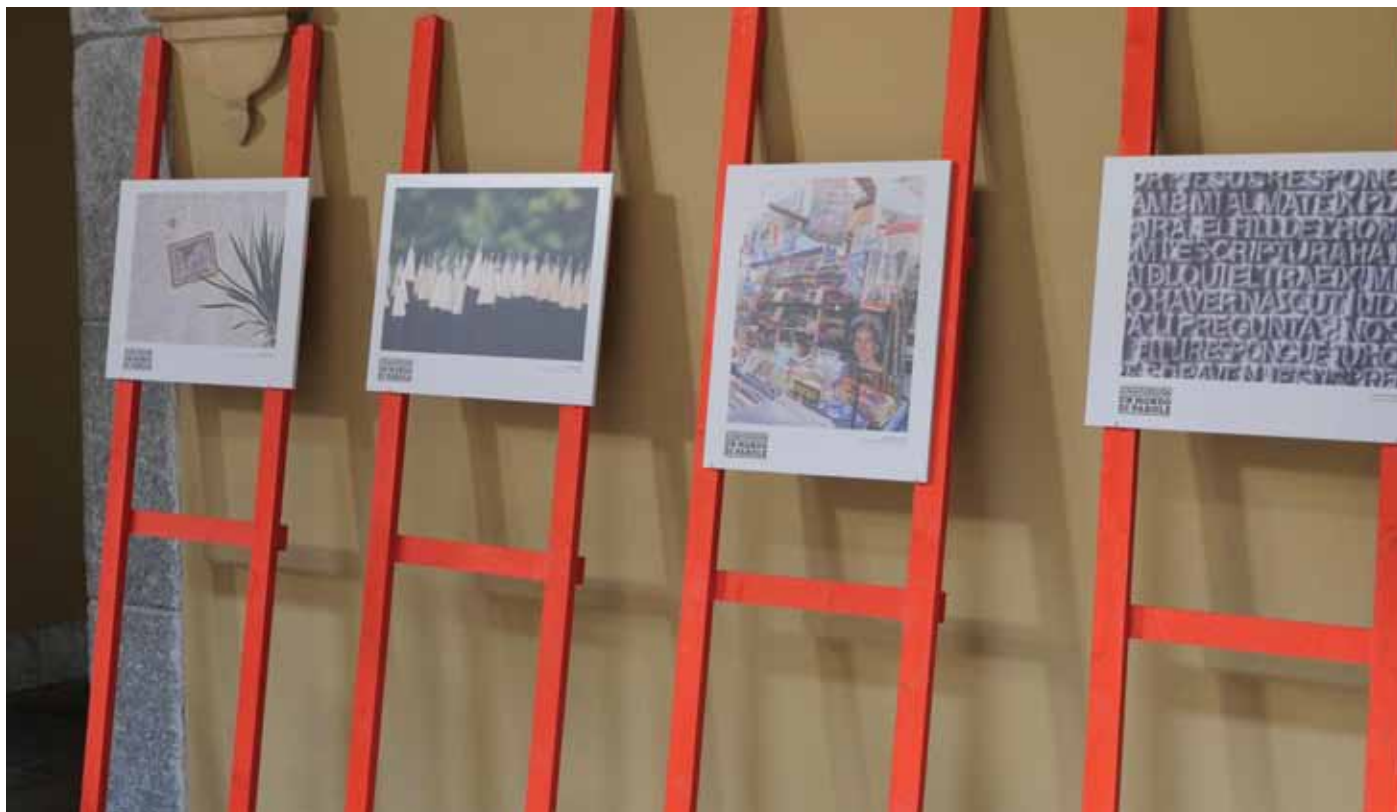
T. 3 Modalità di scoperta del corso (in %)

"Tramite chi (o quale canale) sei venuto a conoscenza del corso?"