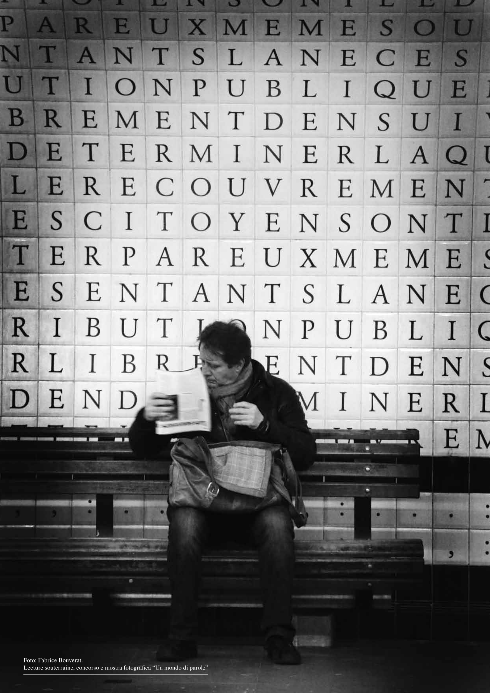
Lecture souterraine, concorso e mostra fotografica "Un mondo di parole"