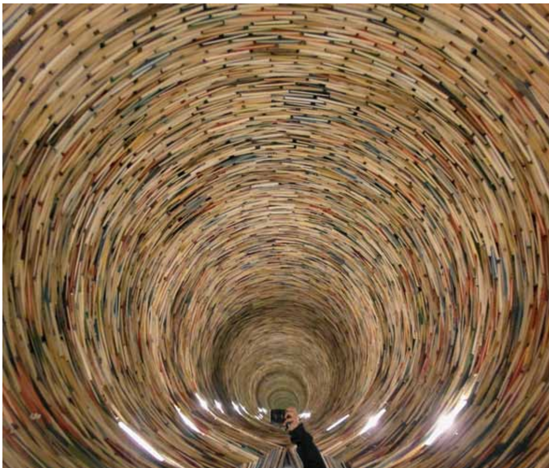
Il girotondo delle parole, concorso e mostra fotografica “Un mondo di parole”

no in molte situazioni della vita corrente. Tutte le lezioni sono piene d'informazioni, che possono essere immediatamente utilizzate. Ho arricchito mio vocabolario e così anche la comprensione di conversazioni e letture. Le professoressa sono altamente qualificate. L'istruzione è non solamente efficace, ma anche un vero piacere. Congratulazioni”. Altri lo consiglierebbero “per imparare e/o migliorare la lingua italiana, perché ha un costo interessante e perché conoscono gente” oppure come luogo di socializzazione “per non stare a casa chiusa, per trovare lavoro, conoscere gente altre nuove”. In quest'ottica i corsi di lingua non sono considerati unicamente come fonte di apprendimento specifico bensì come un'opportunità che “ci permette di integrarci nella società, nel mondo di lavoro, conoscere il territorio dove abitiamo e avere la conoscenza in generale del paese dove viviamo, quindi in Svizzera”.