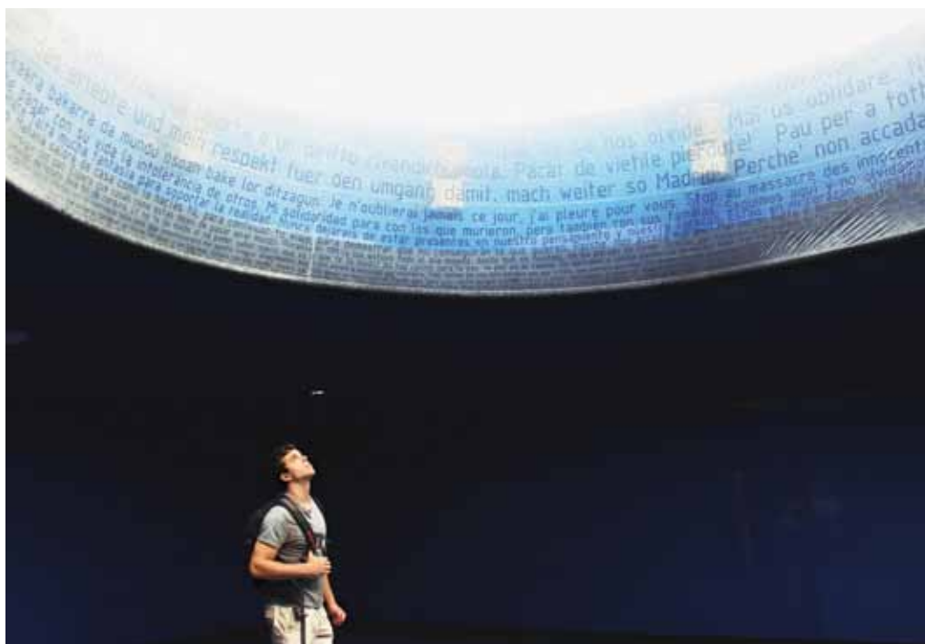
Parole dal mondo, concorso e mostra fotografica “Un mondo di parole”

competenze di base sta dando prova di voler mettere in rete tutti gli attori pubblici coinvolti (singoli uffici coinvolti), come pure privati (es. nella sensibilizzazione). In prospettiva è indispensabile poter coordinare e intensificare in modo sistematico la sensibilizzazione delle OML e delle aziende con le quali la Divisione della formazione professionale è in contatto nell'ambito della formazione professionale di base (apprendistato). Per quanto riguarda gli attori del settore, al Forum competenze di base della Conferenza della Svizzera italiana per la formazione continua (CFC) è stato affidato un ruolo di raccordo importante, sia nella preparazione del catalogo delle offerte ai fini della consulenza telefonica, sia nell'organizzazione di momenti di scambio e informazione (convegni) tra addetti al lavoro.